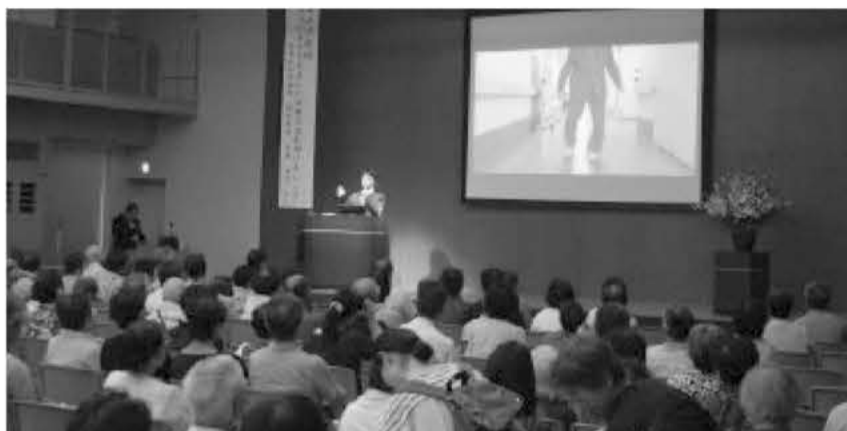
第12回市民講座の様子