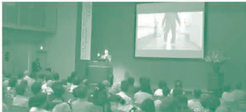
第12回市民講座の様子